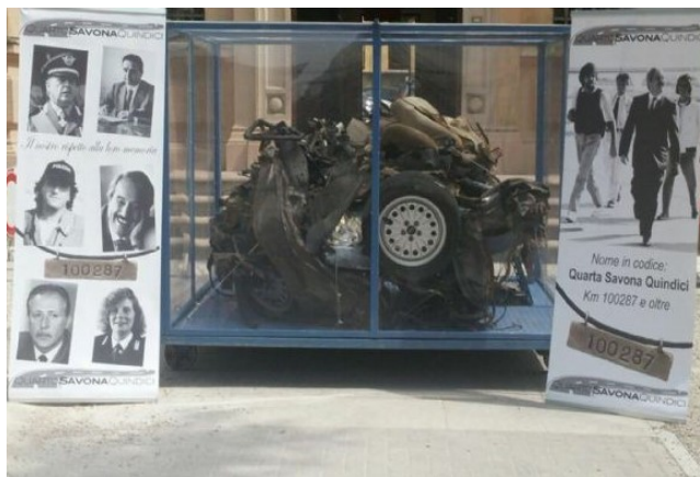
Auto della scorta di Giovanni Falcone

Telefono : 0332.668122 E-mail : info@galileilaveno.it Via alla Torre 16, Laveno Mombello (VA)