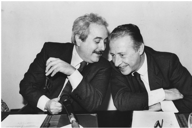
Foto di Falcone e Borsellino