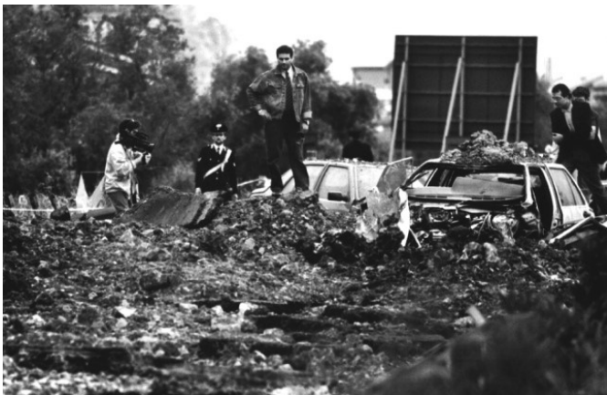
Strage di Capaci, 23 maggio 1992